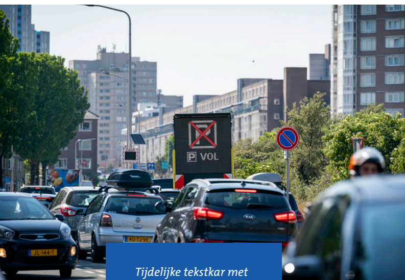
Tijdelijke tekstkar met parkeer informatie

Er wordt dit jaar verder gewerkt aan de invoering van een vast parkeerverwijssystem voor de Haagse kust. De parkeerexploitanten uit de badplaatsen zijn hierbij betrokken. In het tweede kwartaal van 2025 wordt hiervoor het aanbestedingstraject opgestart. Voor strandseizoen 2025 wordt wederom gebruikgemaakt van tijdelijke tekstkarren om de bezoeker goed te kunnen informeren over de verkeerssituatie en de beschikbare parkeerplekken in beide badplaatsen.